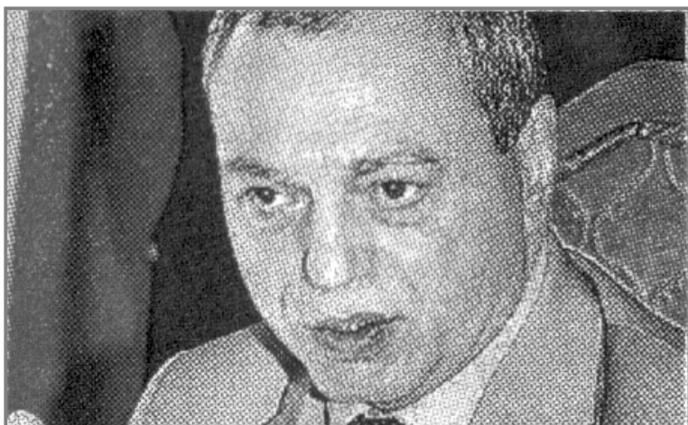
Il questore di Torino, Stefano Berrettoni

nostre sacrosante funzioni. Noi siamo a guardia della legge, che vogliamo immutabile, scolpita nel tempo. Il popolo è minorenne, la città è malata. Ad altri spetta il compito di curare e di educare. A noi, il dovere di reprimere! La repressione è il nostro vaccino! Repressione è civiltà!»